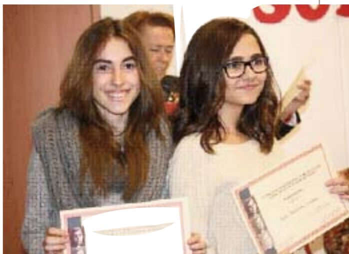
Ganadoras del primer premio