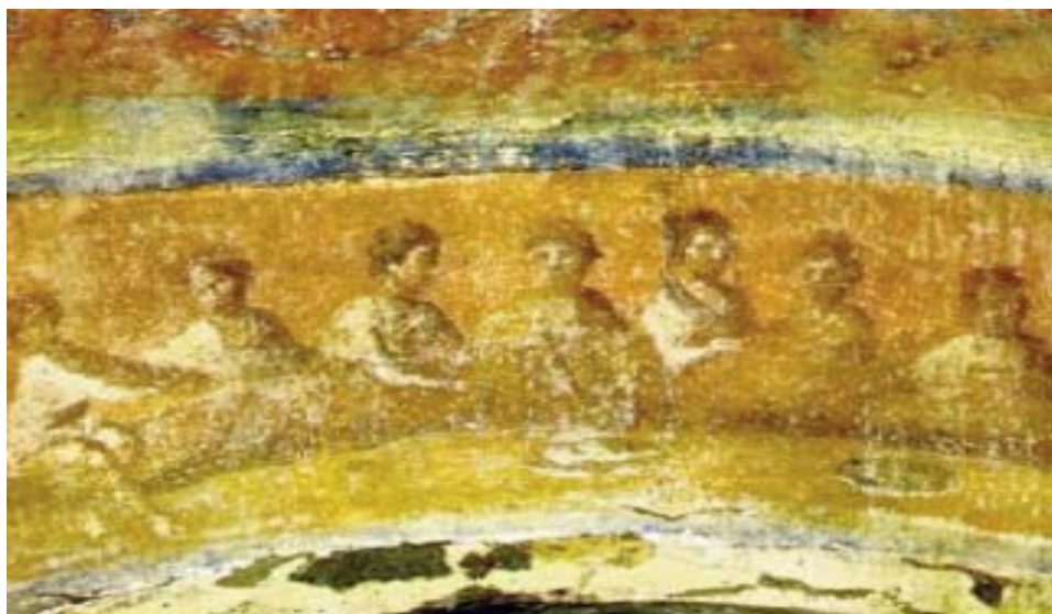
Primeros Cristianos. Catacumba de Santa Priscila (Roma) Siglo II d.c.