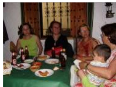
Convivencia y comunicación durante la cena fría

Después de haber pasado unas horas inolvidables emprendemos viaje de vuelta, quedando grabada en nuestra retina, no solo, el arco o pasadizo, que servía de unión entre el palacio y los jardines de los Condes de Vía Manuel a quien perteneció Cheles, y que actualmente conduce a la ermita del Cristo, sino la iluminación de la Iglesia de la Purísima Concepción, situada en la zona más elevada del municipio, edificio reedificado en el siglo XVII I y restaurado recientemente por dentro y por fuera.