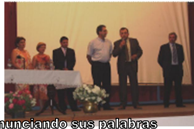
El Alcalde de Hornachuelos pronunciando sus palabras