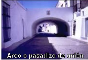
Arco o pasadizo de unión