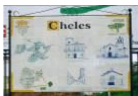
Cheles, frontera con Portugal