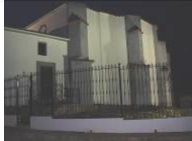
Vista de la Iglesia iluminada recién restaurada por fuera

Acompañados por la brisa del anochecer de un día luminoso donde por la noche seguía alumbrando la luna nuestro regreso, entre los encinares y las curvas de la carretera suavizadas por el gozo de este feliz encuentro, donde el camino se hacía más suave y menos tortuoso,. Decimos ¡Adiós! a Cheles hasta la primavera de 2006, en que vendrán a Hornachuelos.