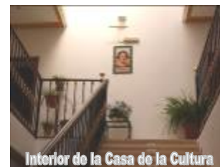
Casa de la Cultura Victoria Díez de Cheles