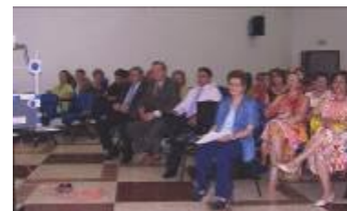
El Salón de Acto de la casa de al Cultura durante el Acto

Terminada esta parte, el Alcalde de Cheles invita a subir al escenario del Salón de Actos a la dos corporaciones para el hermanamiento.