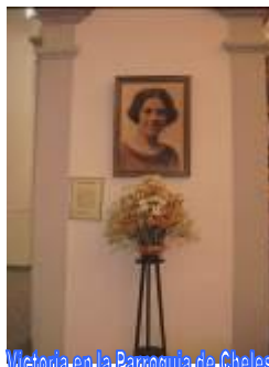
Victoria en la Parroquia de Cheles